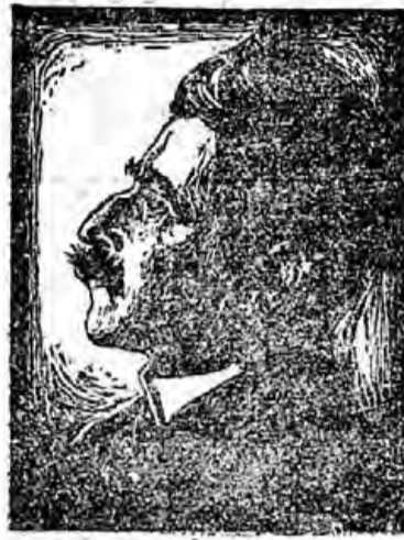
Väinö V. Väänänen.