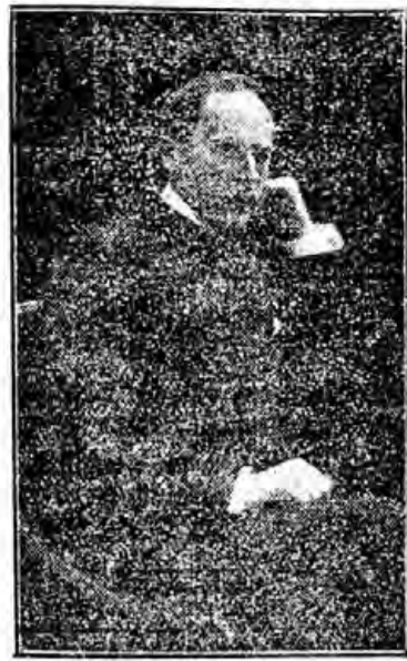
Romain Rolland. (S.H.)